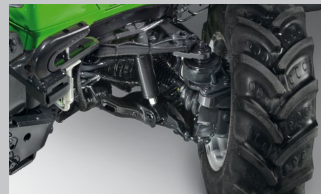
Gefederte Vorderachse mit Einzerradaufhängung und großem Lenkeinschlagwinkel für maximalen Fahrkomfort und Wendigkeit.