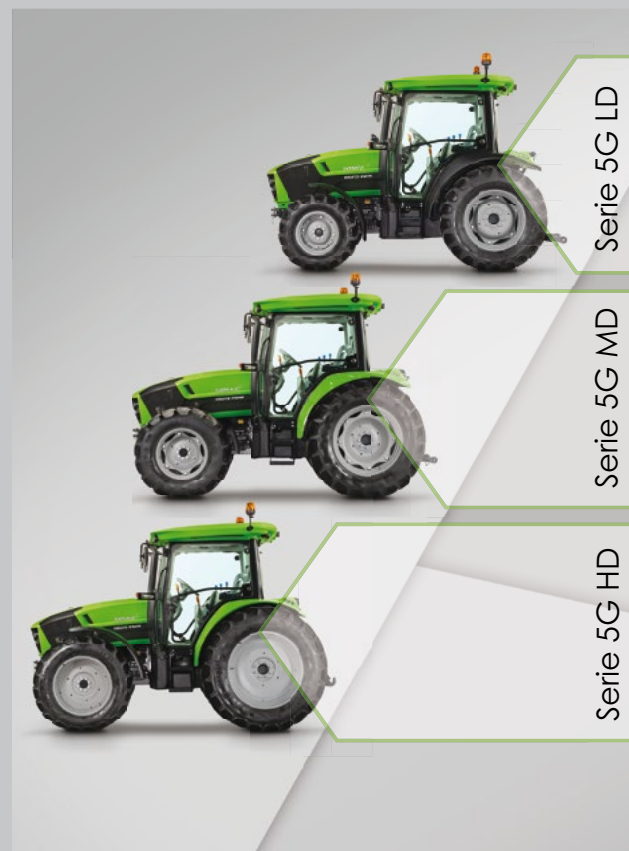
Serie 5G LD

Die Serie 5G von DEUTZ-FAHR sucht dank des modularen Aufbaus in punkto Vielseitigkeit ihresgleichen. Vom Frontladereinsatz auf engstem Raum bis zur schweren Bodenbearbeitung – mit insgesamt 11 Modellen bietet die Serie 5G für jeden Einsatz den passenden Traktor. Mit 3-Zylinder Motoren von 55 kW (75 PS) bis 71 kW (97 PS), max. 5.800 kg zul. Gesamtgewicht und 30" Bereifung sind die LD-Versionen die kleinsten Vertreter. In der Mittelklasse bieten die MD-Varianten je nach Leistung 3- oder 4-Zylinder Motoren mit 65 kW (88 PS) bis 80 kW (109 PS), max. 6.200 kg zul. Gesamtgewicht und 34" Bereifung. Die großen HD-Versionen bieten ebenfalls 4-Zylinder Motoren mit 65 kW (88 PS) bis 80 kW (109 PS), aber 7.500 max. zul. Gesamtgewicht und 38" Bereifung.