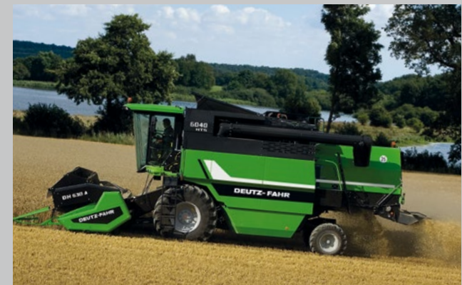
Ein hochattraktives Preis-Leistungs-Verhältnis bietet der DEUTZ-FAHR 6040.

0% Kosten. 100% Ertrag. Sichern Sie sich jetzt die einzigartige DEUTZ-FAHR Bruttofinanzierung und ernten Sie eine Saison kostenlos. Das Top-Angebot gilt für das aktuelle Mähdrescherprogramm von DEUTZ-FAHR: 6040, C6000, C7000 und C9000. 5- und 6-Schüttlermaschinen im Leistungsbereich von 186 kW (250 PS) bis 290 kW (395 PS). Beim Kauf eines 6040, C6000, C7000 oder C9000 Mähdreschers bis zum 29.02.2016 sind 100% des Kaufpreises inklusive MwSt. voll finanzierbar. Beispielsweise bei Finanzierungsbeginn 01.05.2016 ist die Anzahlung in Höhe der MwSt. im September 2016 fällig, die erste Rate im Februar 2017.