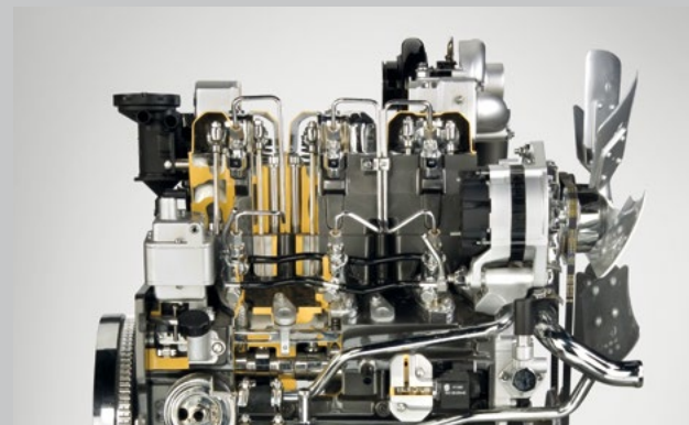
Serie 1000 SDF Motor.