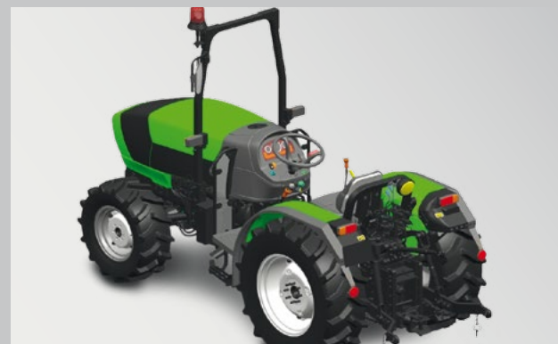
Kompakte Abmessungen (minimale Außenbreite 1.450 mm) kombiniert mit der größten Hubkraft in dieser Klasse.