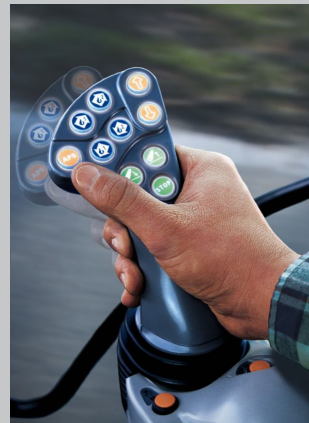
Cshift-Schaltung. Jetzt beim Komfort einen Gang höher schalten.

Das Komfort-Highlight aber ist die Cshift Schaltung. Damit haben Sie alle Gänge im Griff. Sie schalten ohne zu kuppeln bequem, präzise und schnell per Joystick. Die Cshift Schaltung macht die Serie 6 zum idealen Traktor für alle, die weniger Arbeit bei der Arbeit haben wollen. Dem stimmen auch die Technikredakteure des Deutschen Landwirtschaftsverlags dlV und seine europäischen Partner zu: Sie haben die Serie 6 Cshift auf der Agritechnica 2015 als "Maschine des Jahres 2016" in der Kategorie "Traktor obere Mittelklasse" ausgezeichnet.