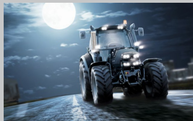
... der 6190 Cshift WARRIOR.