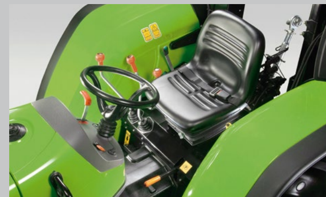
Durch die ergonomische Anordnung sämtlicher Bedienelemente kann der Fahrer den Traktor einfach und mühelos steuern.