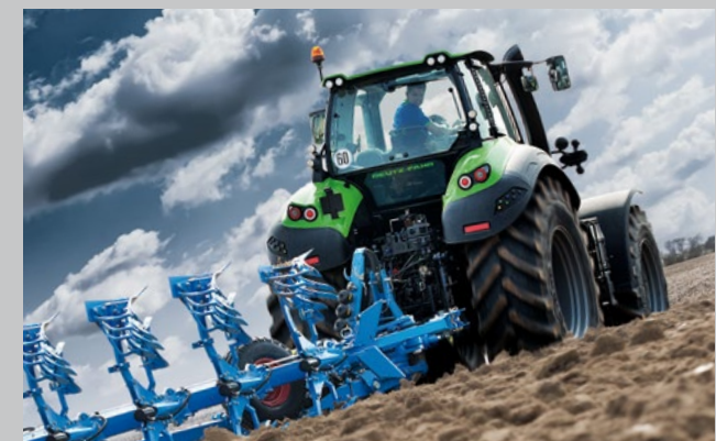
Hocheffizient bei schweren Feldarbeiten ...

Mit der Serie 9 bietet DEUTZ-FAHR drei perfekt abgestimmte und attraktive Großtraktorenmodelle, mit denen Landwirte und Lohnunternehmer beste Resultate erreichen können.