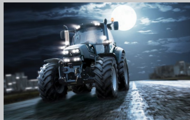
Die neuesten WARRIOR Modelle. Der 6190 TTV WARRIOR und ...

Zur WARRIOR Sonderausstattung gehören die brillantschwarze Lackierung (a.W. auch in DEUTZ-FAHR Grün), der Auspuff mit Edelstahlblende, das WARRIOR LED-Beleuchtungspaket, die nachtschwarze WARRIOR Fußmatte, 3 Jahre Gewährleistung und einiges mehr.