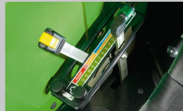
Alle Bedienhebel für den Krattheber sind griffgünstig rechts neben dem Fahrersitz positioniert.