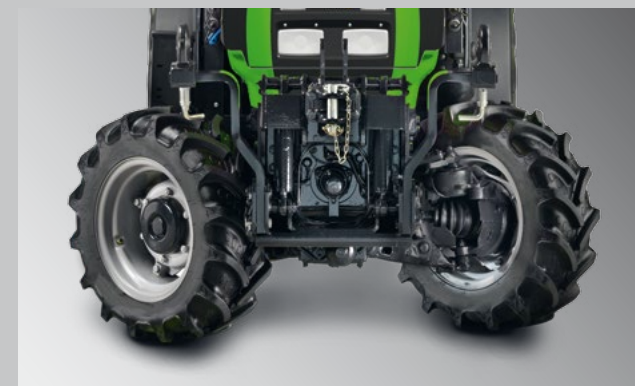
Ein niedriger Schwerpunkt sorgt für gute Stabilität.