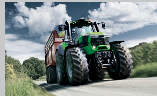
... genauso wie beim schnellen Straßentransport.